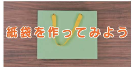
「紙袋制作教室」の動画