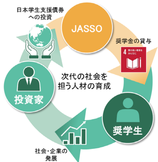
JASSOソーシャルボンドのフレームワーク