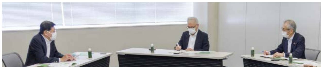
エンゲージメント対談の様子