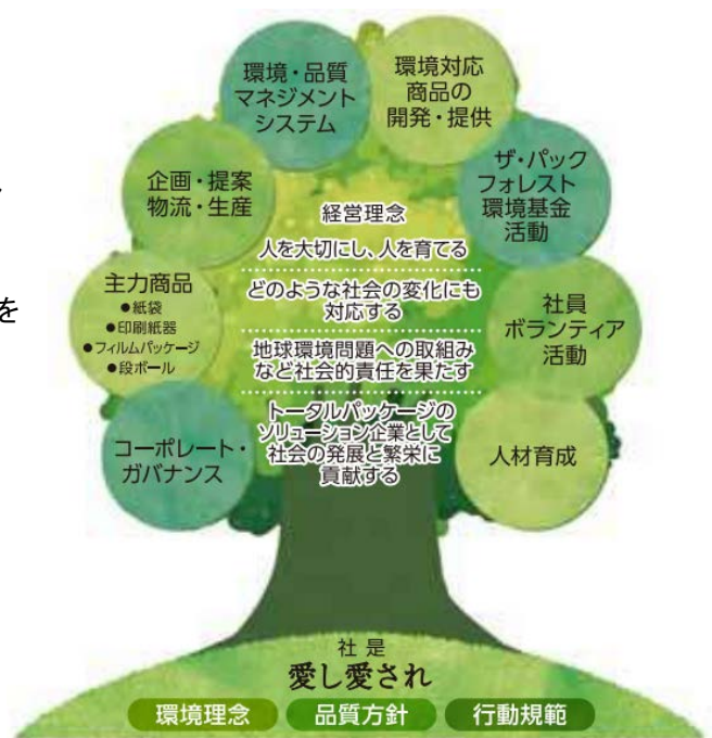
ザ・パック株式会社 経営理念と企業理念体系図

この投資枠を策定後、第1号という形で、JASSOソーシャルボンドへの投資を決定した、というのが経緯です。