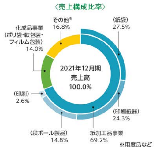
ザ・パック株式会社 取り扱い製品と売上構成比率