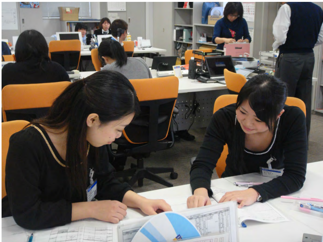
ソニーコーポレートサービス株式会社でのインターンシップ風景