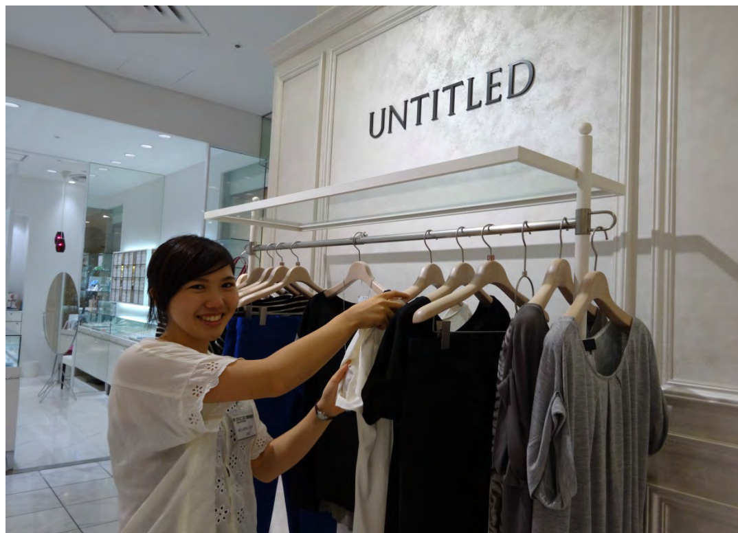
株式会社ワールド(UNTITLED)でのインターンシップ風景