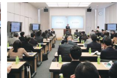
総会(田町キャンパスイノベーションセンター) 2017年3月16日開催