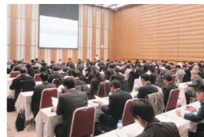
設立総会(経団連会館) 2016年3月11日開催

活動報告や今後の活動予定を発表するなど、産学官の協議・情報共有の場として年に数回開催しています。