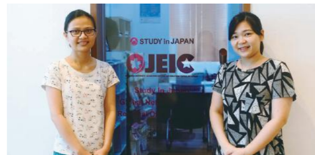
岡山大学日本留学情報センター「OJEIC」(ミャンマーヤンゴン事務所)

ヤンゴンとマンダレーの現地事務所を活用し、情報の共有と発信、現地関係機関との連携構築を推進しています。