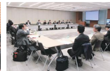
世話人会(東京・三菱商事) 年3回開催