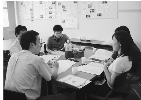
図2 ワークショップの様子

学内で収集したノウハウをまとめるために、教務学生業務の経験の長い職員とともにミーティングの機会を何度も設け、どのような枠組みでノウハウを整理するのかの検討を行った。その結果、これまでの『ティップス先生からの7つの提案』の枠組みにそってノウハウを分類することが可能であり、同じ分類方法によってシリーズとしての『ティップス先生からの7つの提案』のコンセプトを明確にできると判断した。具体的には、次の七つの枠組みに分類した。