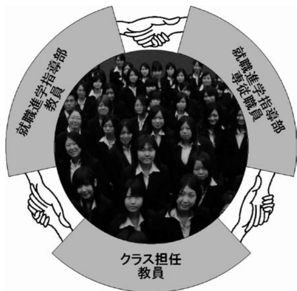
図1 「“Face to Face” の就職支援」体制