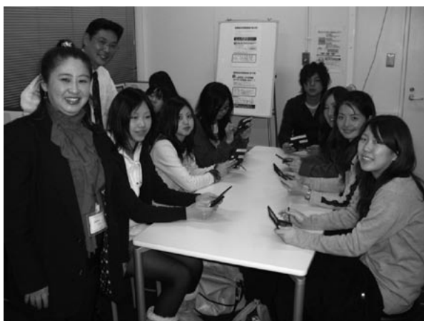
写真2 学習スペースでの勉強会

9月に学習指導担当の専門職員1名を雇用し、整備した学習スペースを利用して、個別学習指導を開始した。筆記試験対策としては、小グループによる夕方の勉強会を11月から毎日開催し、12月10日までに延べ204人が参加している。当勉強会については、毎週学生に案内し、より多くの学生参加と学習の継続を推奨している。個別指導としては、メディア学習での質問対応、面接指導、履歴書作成指導、就職全般の相談対応等を行っている。昨年までよりも就職進学指導室に訪れる学生数が格段に増え、指導室内は活況を呈しており、その雰囲気 학생들이意識向上にも好影響を与えている。