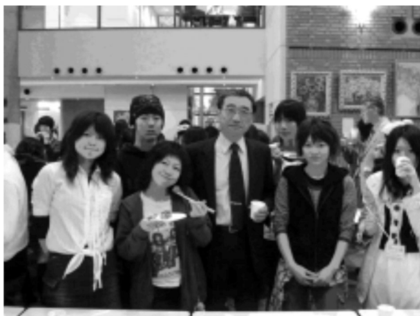
写真1 学長と祝う誕生日会

最初にきちんとした企画書を作成し、終了後も終了報告書をまとめることによって、国際性のみならず社会人基礎力も同時に養うことができる。同委員会はエクステンジプログラム以外にも、国際理解を深めるための多様な活動を行っている。この活動はグローバルコミュニケーションセンターが全面的にバックアップしている。