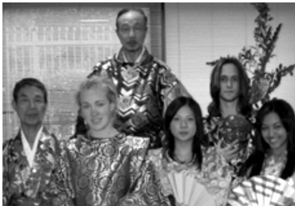
写真2 エクステンジプログラムの例 (伝統芸能「相模里神楽」に出演)