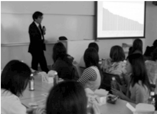
写真3 自宅外の学生の懇親会の中での防犯講座