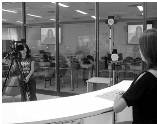
写真5 学内放送で情報発信

こうした活発な活動が広く紹介されれば、高校生、保護者、高校教員、あるいは地域社会、就職先企業などに対しても大きな広報効果がある。事実これまでの活発な活動を知って本学を志望する動機としたという入学志願者も少なくない。