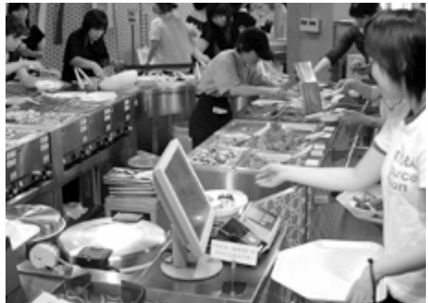
写真4 グラム精算方式のビュッフェ食堂