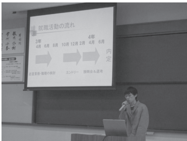
写真1 就職ガイダンス（内定者による体験発表）

3年次を対象に年18回実施し就職活動における指導を行う。また、SPI対策テスト・コンピテンシーテストの実施により学生の学力や適職を把握しながら就職指導を充実させる。