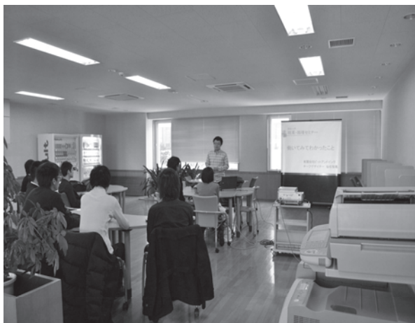
写真3 職業・職種セミナー