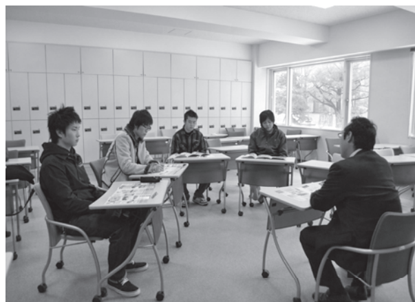
写真4 キャリアプランニング（グループワーク）

企業人・OBによる講演、学力を測るためのSPI対策テスト、職業適性を図るためのコンピテンシーテスト等を行い、早期に将来の目標を持ち学生生活を送れるよう意識の向上を図る。また、従来講義形式の授業が中心であったが、自己分析・自己表現、自分の発揮できる能力を見出すための手法をグループワーク形式で実施することを取り入れる。