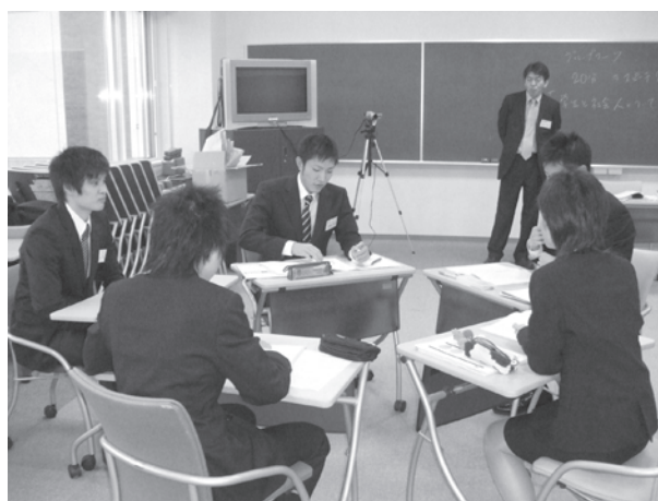
写真5 就職模擬面接

企業の人事担当者を講師として招き、個人面接・集団面接・グループディスカッション等の面接におけるポイントや面接演習を行い、就職活動本番に向けての対策に備える。