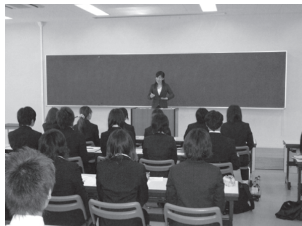
写真2 就活塾「CDA有資格者による講座」

本学就職支援担当部署である入試創職室のスタッフ及び教学組織として入試創職委員会とその下部組織