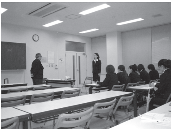
写真4 就活塾「模擬面接①」