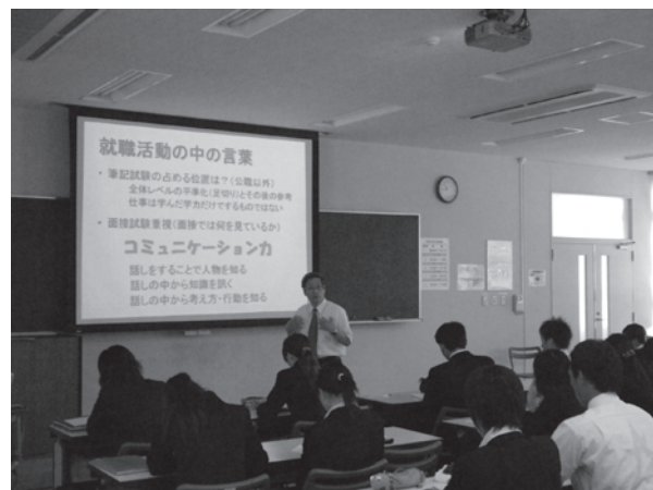
写真3 就活塾「ビジネス基礎講座」

就活本番の時期を迎えた3年生(含む4年生)に対し、「個別の就職相談」を徹底することにより就職実績を向上させるため、5月から7月にかけて「個人カルテシステム」を構築し、個人別必要データや面談記録を蓄積できるようにした。今後のこの個人カルテシステムを積極的に活用し、塾生の具体的な就活のサポートを自主ゼミの指導と合わせて実施することとしている。