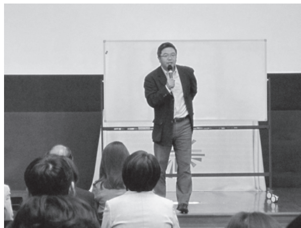
写真2 保護者向け講演会の様子(1)

また、長期化する就職活動に対して学生の継続的な取組を支援するという観点から、大学に加え学生の家庭において就職活動に対する認識を向上させるという目的で、外部講師による保護者向け講演会を年2回実施する。すでに第1回目を4月に行い、参加した保護者からは大変好評を得た。