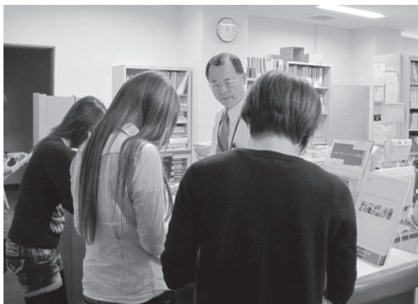
写真1 学生に対応するキャリアアドバイザー

なかでも、大阪労働局との連携により、ハローワーク所長経験者をキャリアアドバイザーとして招聘した。同アドバイザーには、個別学生の面談を基本として、ハローワークをはじめとする各種の学外における支援策の活用を促す役割がある。一方、キャリアサポートセンターの職員と共同で企業に対する求人開拓も積極的に行い、企業と学生間におけるニーズのミスマッチを解消することも期待されている。