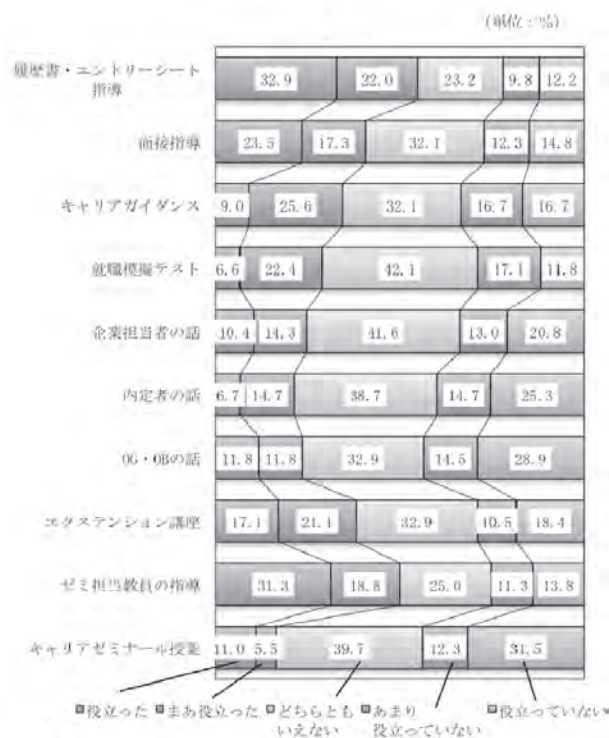
図1 卒業生調査結果：設立した就職支援策