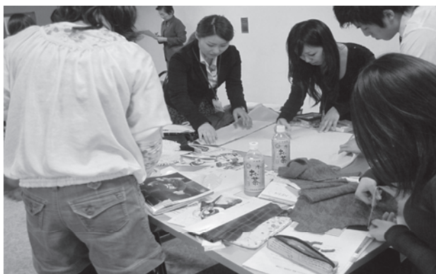
写真3 1DAYインターンシップ

昨年以前のインターンシップは食物栄養学科2年生の2日間の保育園に限られていた。2010(平成22)年の2月には、1日体験インターンシップを企画・実施し、生活デザイン学科教員の指導のもと、1年生が7名参加した。生活デザイン学科の就職はアパレル関連企業の販売職が多く、実習先はアパレル関連の専門商社を開拓した。午前中は業界研究・会社説明とマーケットリサーチ、午後は春物の企画書の作成と発表等充実した内容であった。実習終了後のアンケートには「実際に体験して見てグループで物事を進めていくことの難しさを感じた」「この経験を生かして様々な業界を知ってみたい」「他の企業のインターンシップにも行ってみたい」など、意識の向上が見られた。今後もインターンシップ受入れ先企業を更に開拓して、できるだけ多くの学生たちが社会に触れられる機会を増やすよう努めていく。