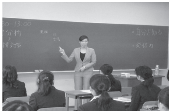
写真2 フォロー講座

この「夏季特別フォロー講座」終了後、参加者には専門学修相談員による個人面談を実施し、更なるフォローを行った。