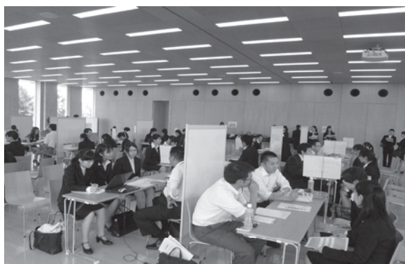
写真1 学内企業面談会

これまでの最高参加企業数は31社（8月実施）で、最低は7社（昨年11月）であった。未内定学生に対して、企業との出会いのチャンスを数多くセッティングすることにより、内定に結びつくように支援した。面談会場内で、壁のそばに佇んでいる消極的な学生達に対しては、希望に近い企業のブースに誘導して貴重な機会を逃さないよう支援した。