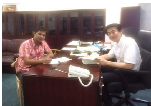
研究アドバイザーとの面談/Meeting with research advisor