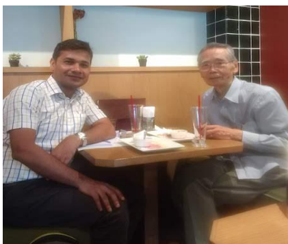
専門家との意見交換/Exchange of views with expert

来日前から書きかけてあった論文が、来日中に初稿完成の段階にまで至った。英文を繰り返し推敲して、より読みやすく、誤りのない論文に仕上げ、国際的な学術誌へ投稿する計画である。それと同時に、今回の来日で得たさまざまな貴重な情報や知見から、政策手段や環境政策の普及に関して新しい論文の構想も湧いてきているようである。今回の来日中にひととおり書き上げた論文を、確実に出版の段階まで持っていくことと、新しい研究の構想を文章化して具体的な計画作成へ向かっていくように指示したところで、帰国の途について。順調に研究が進展して喜ばしく思っている。これから1か月足らずのうちに私がバングラデシュへ訪問する機会があるので、その際に進捗を確かめる。その後は、電子メールやスカイプで交流を続け、研究を指導していきたい。