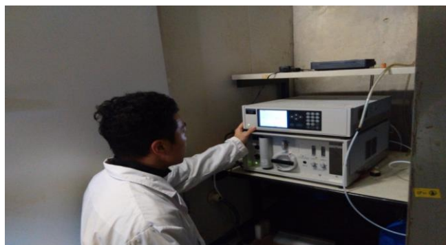
Measuring methane emission from sheep (メタン分析機によるヒツジからのメタン放出量の測定)