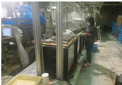
実験模型の準備作業/Preparation works of test models

振動台実験で計測した橋台模型の応答特性や各種対策工法の効果を、有限要素法を用いた動的数値解析により評価する研究の指導を引き続き行う予定である。電子メールで連絡をとりあうことで、研究交流を継続する。