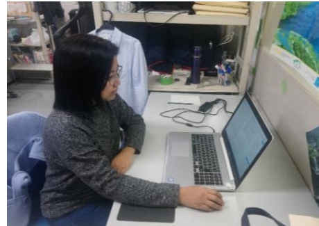
振動台実験結果の分析/Analysis of shaking test data