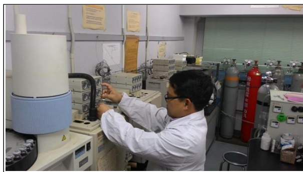
ガスクロマトグラフィーによるガス分析 Gas analysis by gas chromatography