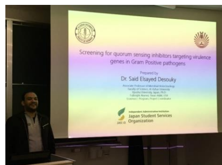
九大農学部でのセミナー/Seminar about fellowship research