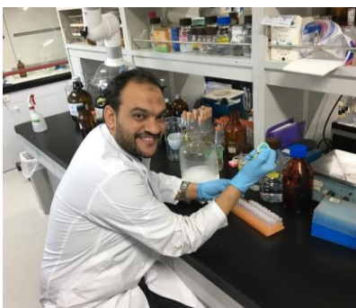
九大微生物工学研究室での実験/Microbial Biotechnology lab

まずは、未発表のクオラムセンシング阻害剤については、論文投稿し、論文発表したいと願っている。また、これまでに、ブドウ球菌や腸球菌のクオラムセンシング阻害剤としてスクリーニングされているものが、偽膜性大腸炎起因菌のClostridium difficileに作用する可能性を追求する。またサンゴの抽出物中のQS阻害活性物質については、精製を完了させ、構造を解析し、化学的実態を明らかにしたい。また、これらの研究を通して、共同研究を進展させ、必要に応じてMOUなど大学間連携も図りたい。