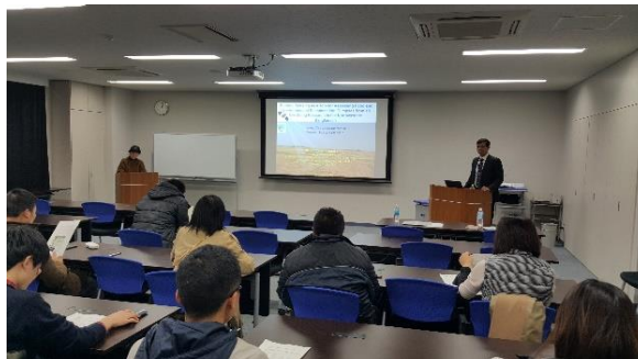
Invited Lecture for the Students of BWEL Program at the Gifu University, 19 December 2018 / 岐阜大学水環境リーダープログラムでの招待講演 (2018.12.19)