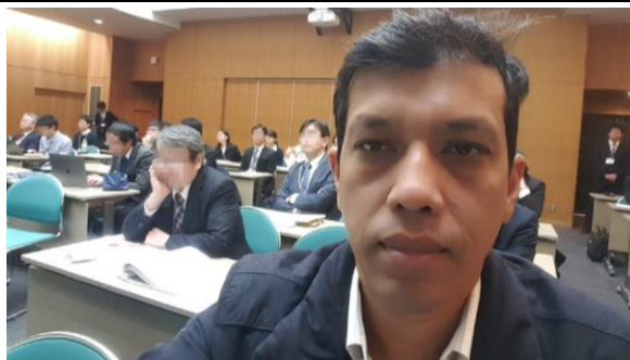
JSCE 63rd Conference on Hydraulic Engineering held at the Hokkaido University, 27 November 2018 / 第63回水工学講演会 (北海道大学; 2018.11.27)