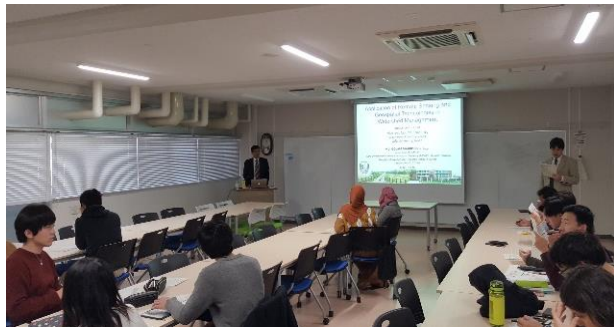
Special Lecture for the MC Students of the Department of Civil Engineering, Gifu University, 11 December 2018 / 岐阜大学大学院特別講義での特別講師 (2018.12.11)