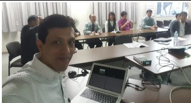
Presentation at Shin Engineering Consultants Co Ltd., Sapporo, 26 November 2018 / (株)シン技術コンサルでの研究発表 (2018.11.28)

バングラデシュHaor地域での生態系保全や降雨流出適正化に資する植林・森林再生計画を実現するには、学術的な研究活動や新しい技術開発はもとより、現地での継続的なモニタリング・データ収集やプロジェクト企画・推進が不可欠になる。今回の日本滞在は、当該外国人研究者およびバングラデシュでの研究者・実務者と我が国の様々な研究者・専門家を結びつける絶好の機会となった。当該外国人研究者の留学先指導者としては、専門的知見の提供に留まらず、日本とバングラデシュの共同プロジェクトの企画なども図りつつ、ハブ的な役割も担いながら研究を進めていきたいと期待している。