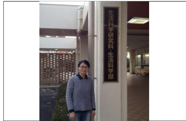
写真タイ大阪市立大学生活科学研究科前/In front of the