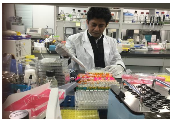
96ウェルプレートを利用した実験の準備