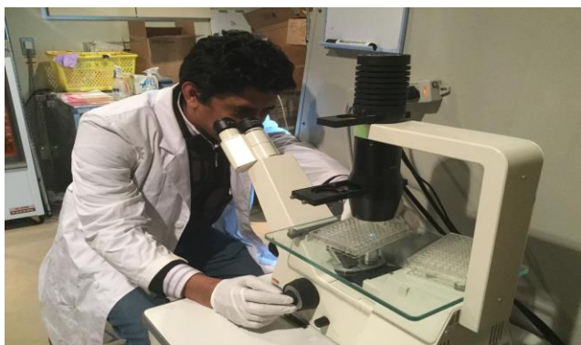
96ウェルプレートでの化合物添加細胞の形態観察 Morphology check of compounds added cells by using 96-well plate