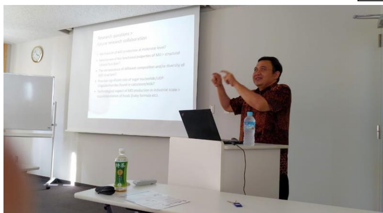
Giving Special Lecture at ICB Osaka University 大阪大学での講義