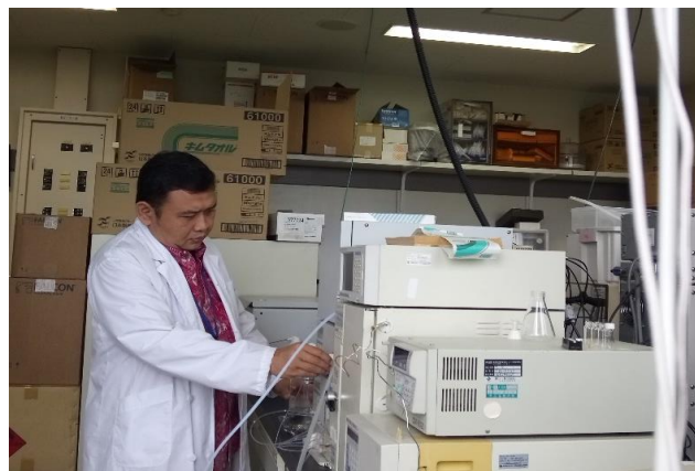
Preparing for HPLC analysis HPLC分析をしているところ

ヤギ初乳より糖ヌクレオチドを効率的に分離・精製する方法の開発を行い、乳に固有のオリゴ糖ヌクレオチドの探索を行う。それについては国際学術誌への論文投稿を行う予定である。