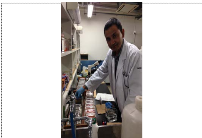
Immunostaining of breast cancer in GATA-3, Ki-67, PAKT) in biomedical laboratory science TMDU

今後とも受入側の研究者と緊密な連絡を取って、学んだ免疫組織化学的検討方法を病理診断の補助診断として用いると共に、主に癌を対象として免疫病理学的研究を推進していく予定である。