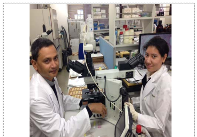
Interpreting immunohistochemistry results Pathology laboratory TMDU, 5th floor