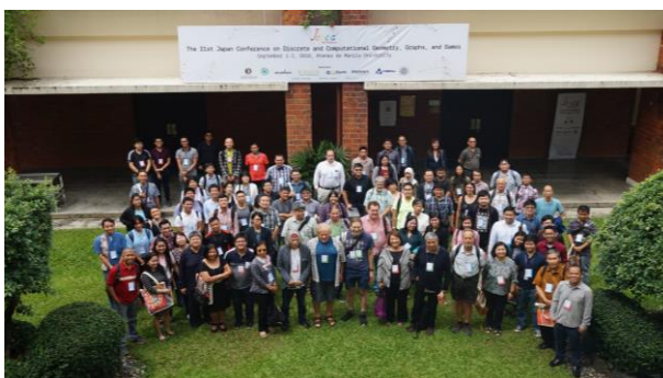
Attending the 21st Japan Conference on Discrete and Computational Geometry, Graphs, and Games (JCDCGGG2018) 国際会議JCDCGGG2018への参加