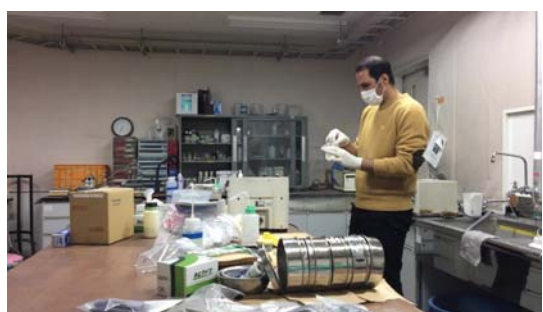
各種分析に用いる試料作成をする外国人研究者 / Sample preparation for geochemical and mineralogical analysis