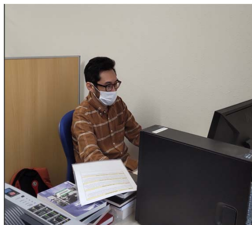
研究室での研究風景 / Research Activities in a Researcher Room