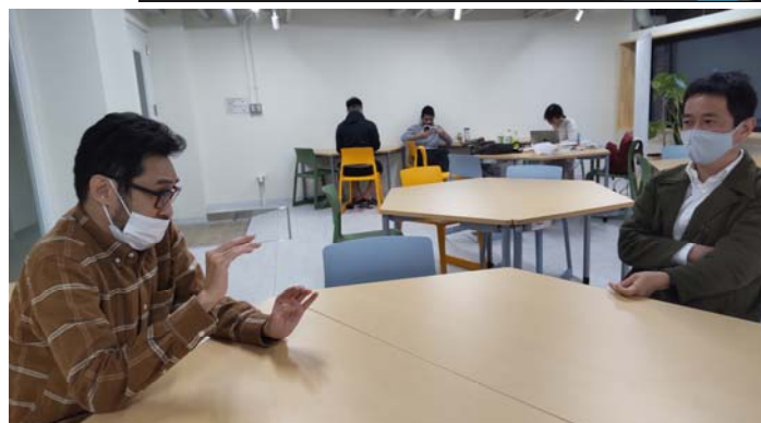
研究内容についての意見交換 /Discussion on the Research