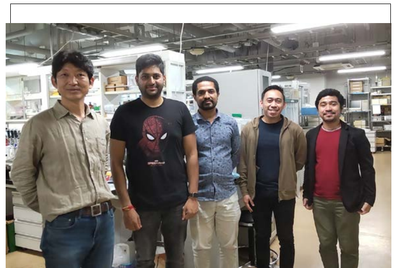
実験室にて博士課程留学生と共に/With PhD students in the laboratory