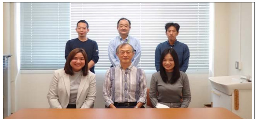
元大阪工業大学教授(中央)より、沿岸海域の底質中の重金属濃度について、結果を見て頂き、貴重なコメントを頂いた。