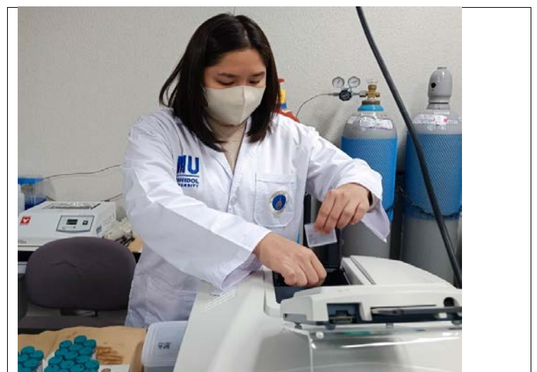
香川大学の実験室にて、沿岸海域の表層泥中のリンを分析中