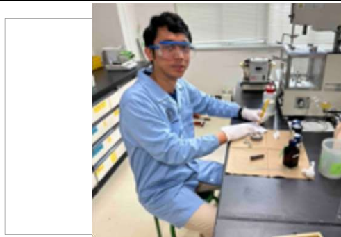
MCC合成を行った/Experiment in chemical synthesis laboratory