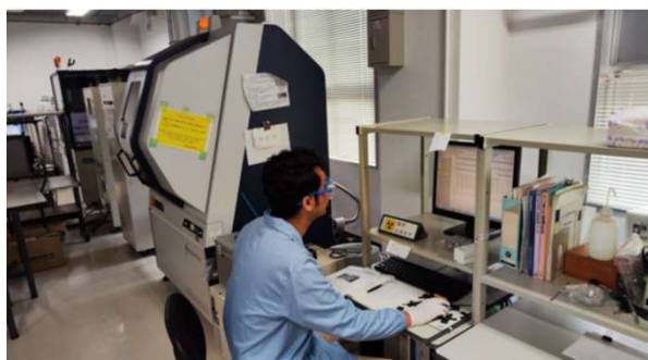
高輝度PXRD装置での測定/Performing PXRD measurement in the instrument laboratory

今後、医薬品MCC結晶の合成、結晶構造と物性の相関に関する共同研究を継続して行うこととした。外国人研究者は多数の医薬品化合物とその問題点について研究実績があり、本研究グループはコフォーマー分子に関する化学的な知見とX線回折装置を使った解析に強みがある。これらを組み合わせることで、研究がスムーズに進むと考えられる。テルミサルタン無水塩の多形変換や塩結晶間の関係には重要な研究テーマであり、粉末回折、単結晶構造解析による構造決定を中心に継続的な共同研究を行う。これをさらに展開し、新しい原薬についてはMCC形成、物理化学的性質の評価を海外で、構造研究を本研究グループで分担する新しいプロジェクトを発足させた。また同じ分野の研究者として2024年に国際会議での共同研究発表、論文の共同出版も予定しており、学生を含めた相互訪問による共同研究の推進も視野に入れている。