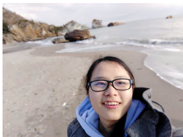
Kỉ niệm bên bờ biển

Trải qua hơn 2 năm học ở đại học tại Việt Nam và gần 1 năm ở đại học tại Nhật Bản, mình cảm thấy có nhiều điểm giống và khác nhau. Việc học ở cả hai môi trường đều chú trọng vào việc sinh viên nghe giảng trên lớp một phần và tự tìm tòi học tập thêm ở nhà là chính. Các bài kiểm tra và báo cáo đều mang mục đích giúp cho sinh viên hệ thống lại các kiến thức đã học. Tuy nhiên, điểm khác biệt lớn nhất là quá trình nghiên cứu. Ở trường Đại học Công nghệ Nagaoka, mỗi sinh viên sẽ được phân vào phòng nghiên cứu có chủ đề mà bản thân quan tâm, được tự nghiên cứu một đề tài dưới sự hướng dẫn và quản lý của thầy cô và sẽ báo cáo nghiên cứu của mình tại các buổi hội thảo khoa học. Các thiết bị nghiên cứu hiện đại được đầu tư và môi trường phòng nghiên cứu rất thân thiện và thoải mái. Điều khó khăn nhất trong quá trình học tập ở Nhật đối với mình là vấn đề ngôn ngữ nhưng mình tin dần dần bản thân sẽ khắc phục được. Ngoài ra, nhờ kết bạn với người Nhật thông qua các hoạt động giao lưu, mình được học hỏi thêm nhiều điều về Nhật Bản. Dù nhớ gia đình và cuộc sống ở Việt Nam nhưng nhờ những người bạn, những người anh, chị Việt Nam đang học tập tại trường luôn giúp đỡ và quan tâm mà mình cảm thấy vẫn có thể tiếp tục nỗ lực học tập.