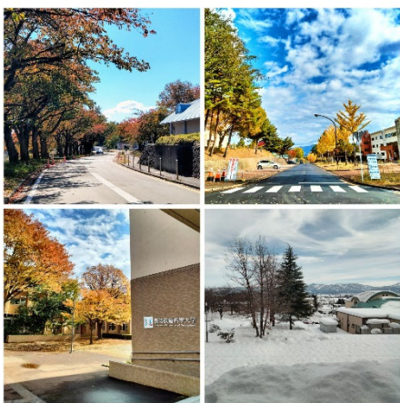
Bốn mùa tại trường Đại học Công nghệ Nagaoka

Du học Nhật Bản thông qua Kỳ thi Du học Nhật Bản EJU là một con đường phù hợp cho những bạn có mong muốn và dự định. Vừa là cơ hội ôn tập kiến thức của bản thân, vừa có thể được nhận vào ngôi trường mà mình yêu thích là điểm đặc biệt mà mình rút ra sau khi đã sử dụng cách thức này để du học. Đối với những ai đang còn ngần ngại vì một lý do nào đó, hãy cho bản thân một cơ hội để có thể học tập, trải nghiệm cuộc sống và văn hóa tại đất nước Mặt trời mọc xinh đẹp này.