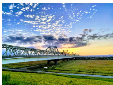
Cầu Chosei trong chiều hoàng hôn