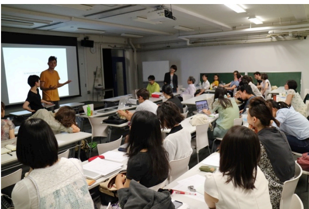
東京藝術大学での共同授業

新学期開始以後、東京藝術大学ではプロジェクトテーマ「私と自然」に関するリサーチを開始した。同時に国際コミュニケーション力を高めるため、ネイティブ教員による講義も開設した。5月はプレセッションとしてエコール・デ・ボザールの教員2名を招聘し、共同授業、特別講義、ワークショップ等を行った。フィールドワークとして本プロジェクトの最終成果を発表する、新潟県十日町市まつだいエリアへ赴き、大地の芸術祭に参加するための現地視察を行った。