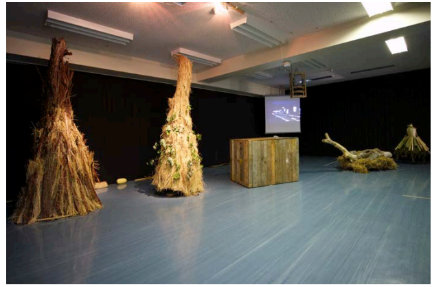
大地の芸術祭 奴奈川キャンパスでの展示 (2)