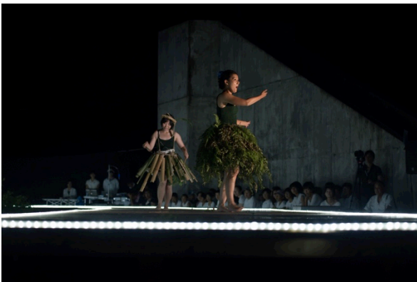
ペアによるパフォーマンスの様子(1)

この経験は「集団」と「個」というものを見据えるきっかけにもなり、ひいては「自分は一体何者なのか」という人間の根源的な問いに繋がった。つまり「自己アイデンティティ」に対する模索である。アメリカの心理学者のエリック・ホーンブルガー・エリクソンによると、「自己アイデンティティ」は大きく2つに区分される。ひとつは「社会的アイデンティティ」で、国家・民族・言語・帰属集団・職業・地位・家族・役割などの社会的な属性・関係によって自己を認識するものである。もうひとつは「実存的アイデンティティ」で、唯一無二の存在であるという実存性によって自己を認識するものである。本プロジェクトはまさに両アイデンティティの確立に繋がる教育プログラムとなった。「日本人である自分」を深く省察することは、国際教養人として成長するために欠かせない通過儀礼のようなものである。さらに本プロジェクトでは「アーティストである自分」とも対峙しなければならない。従来アーティストは「個」で勝負する孤独な一面を抱えている。とはいえ「現代アートの社会実践」を掲げた本プロジェクトに参加する以上、他者との関わりや社会に対する客観性、批評的眼識等が不可欠となる。他者とのコミュニケーションから逃れられない。しかし芸術分野におけるコミュニケーションに関しては、言語能力だけでは済ますことのできない側面がある。学生たちはそれらを実体験しながら、「他者」と「自己」との内面の葛藤に打ち勝ち、「自分が何者なのか」を認識し、最終的に自己同一性（アイデンティティ）を導き出すに至ったのではないだろうか。