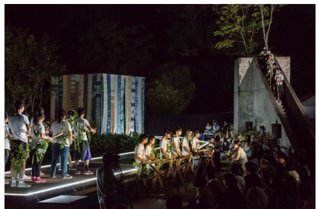
香港の学生による竹の演奏