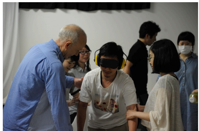
東京藝術大学での五感を感じるワークショップ

その後6月に第1セッションとして2週間、本学の教員と学生が渡仏し、エコール・デ・ボザールにて共同授業、ワークショップ等を行った。本学の学生は各自英語にてプレゼンテーションを行い、