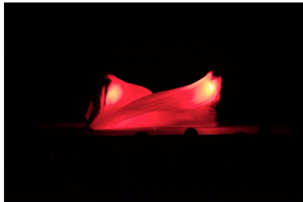
ペアによるパフォーマンスの様子(2)