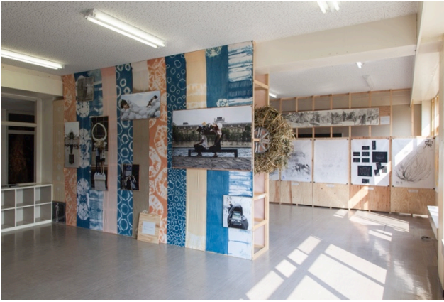
大地の芸術祭 奴奈川キャンパスでの展示 (1)