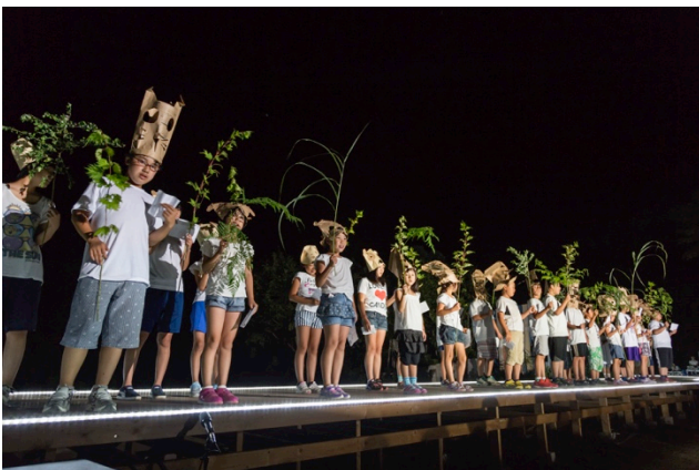
こどもたちによる歌の披露