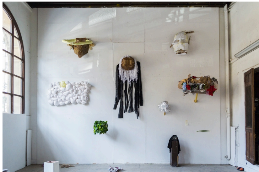
ボザールでの仮面（マスク）の展示