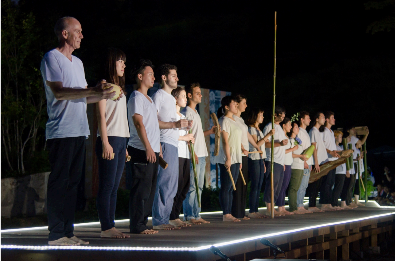
パフォーマンスの様子

パフォーマンスの成果は現代美術としての舞台装置や衣装制作、身体表現等である。その成果は大地の芸術祭の会場のひとつである奴奈川キャンパスにてドキュメント展示として公開した。