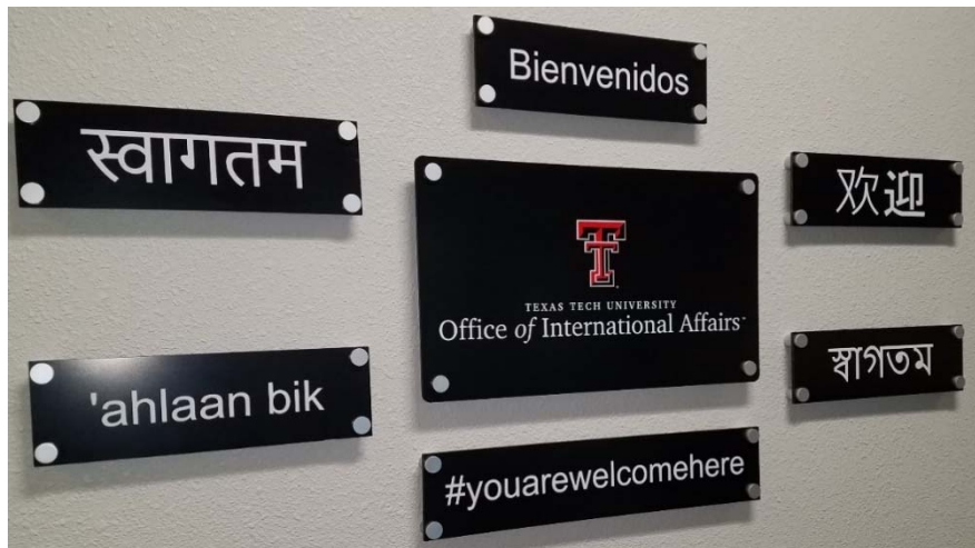
図 3. テキサス工科大学国際文化センターの多言語によるウェルカムの表示

米国政府は変わり、日本からの潜在的な学生に前向きなメッセージや歓迎のメッセージを送っていませんが、米国の大学の態度には変更なく留学生を歓迎します。