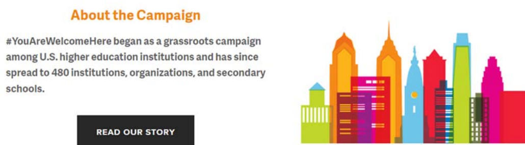
図 2. NAFSA： 「あなたを歓迎キャンペーン」実施の国際教育者の協会。

私が現在勤務している TTU 等の教育機関は、この取り組みを熱心に支援しています。TTU は、私たちの教育機関が、留学生を実際に非常に歓迎していることを伝えることを試みた動画を投稿しました (Texas Tech University、2019)。