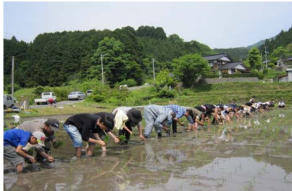
智頭町田植え作業