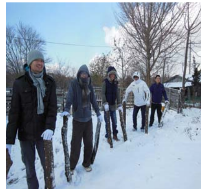
大山町ホダ木作り作業