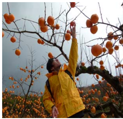
八頭町柿収穫作業