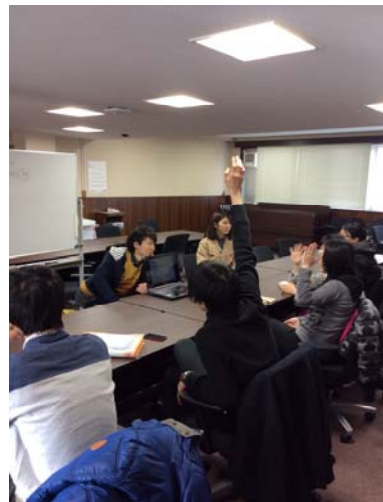
第7回「ES削減セミナー・就活事情」の様子