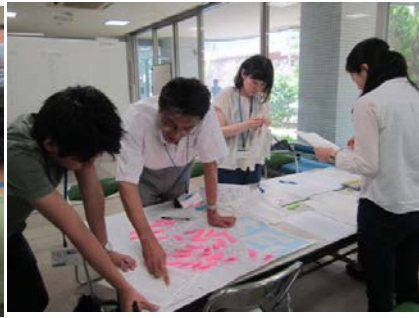
避難所巡回訓練の準備