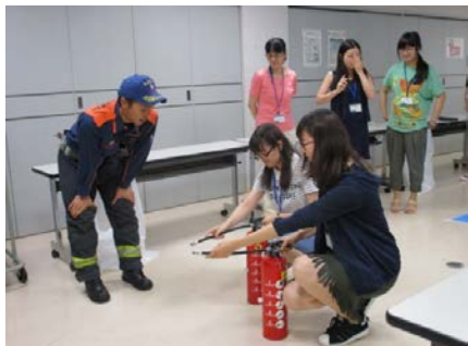
消火器の使い方の指導