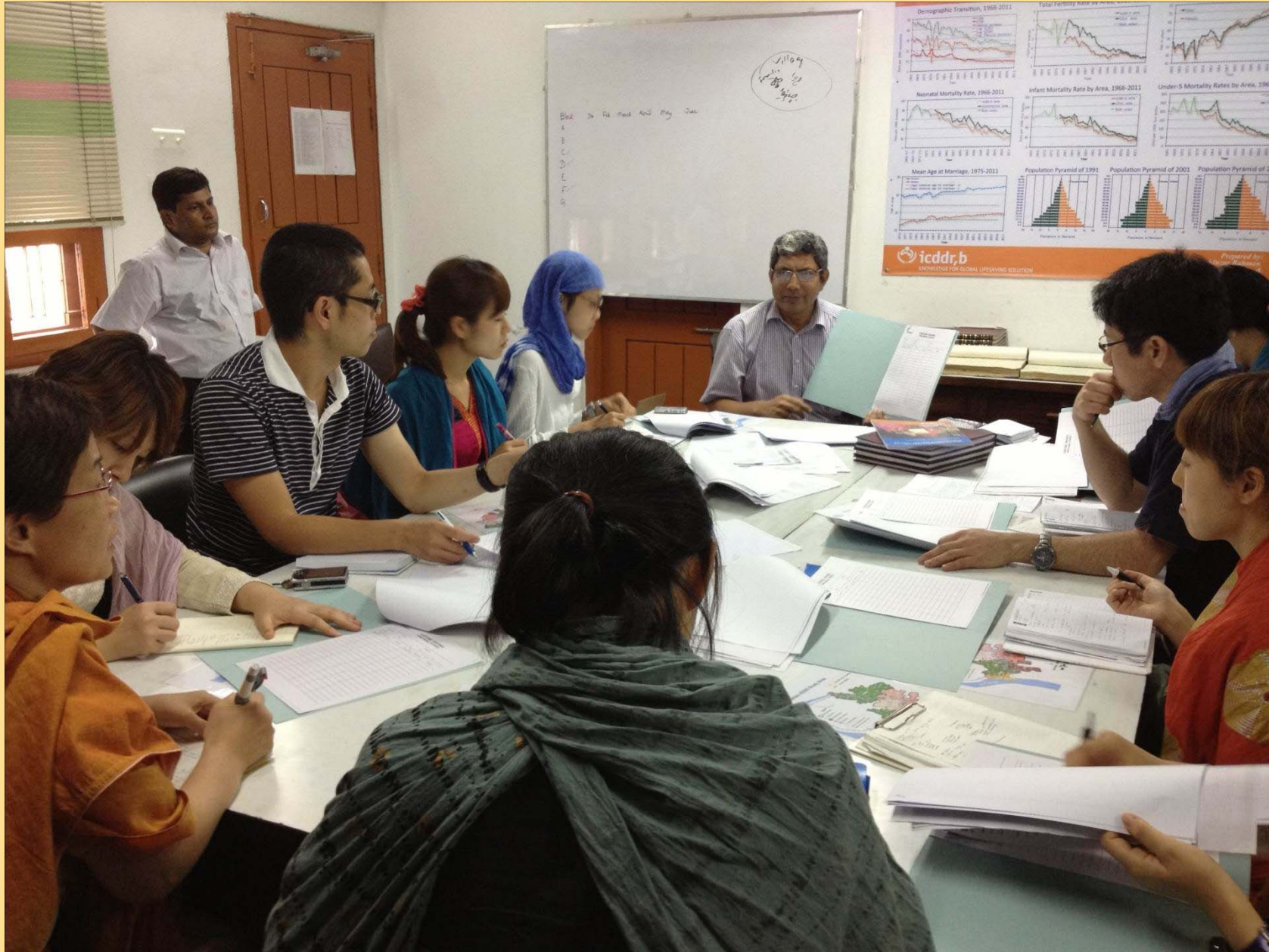
ICDDR,BマトラブにてHDSS(保健人口静態動態調査システム)の説明を受ける本研究科学生たち