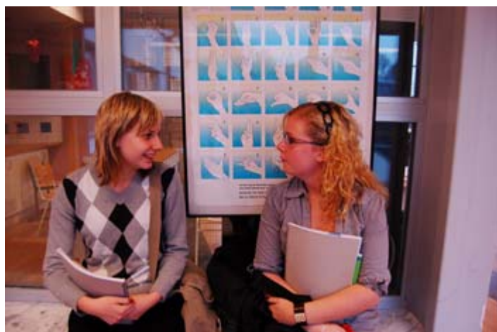
図 1 4 . 聴覚障害生徒のコース

望する学生もいる。障害学生を対象としたカウンセラーも配置されていて、大学での教育やより高度な職業訓練をうけるコースへのガイドや支援を行っている。