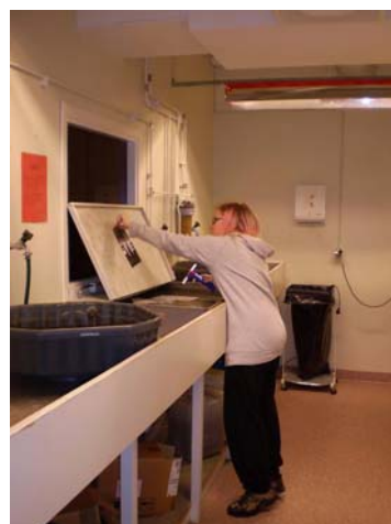
図 1 5 . 写真プログラム