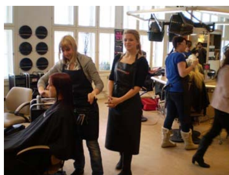
図 1 8 . 美容プログラム

この高校を卒業後、実際に芸術や工芸の分野で活躍している著名な卒業生も多いとのことであった。図 19 は、メディアコースの生徒が作成した学校紹介パンフレットの一部分で、生徒の作品のうちいくつかはプロの批評家からも高い評価を受けているという。