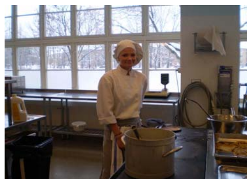
図 1 7 . 調理プログラム

この高校を卒業後、実際に芸術や工芸の分野で活躍している著名な卒業生も多いとのことであった。図 19 は、メディアコースの生徒が作成した学校紹介パンフレットの一部分で、生徒の作品のうちいくつかはプロの批評家からも高い評価を受けているという。