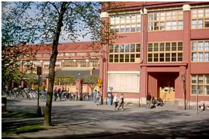
図13. かつて靴工場だった校舎

聴覚障害セクションの主任，教員，生徒と面会し，校内視察およびインタビュー調査を行った．この高校は約1400名の生徒と250名の教職員からなるオレブロでは最大規模の高等学校である．かつて靴工場であった建物(図13)を改築して学校として使用しており，大きな建物の中に様々な設備の部屋が用意されている．社会に出てから