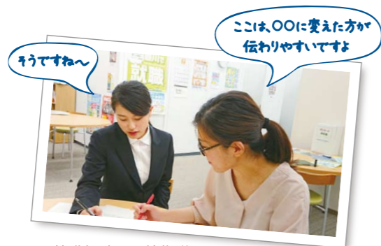
就職相談や面接指導、 応募書類の添削などにも対応しています

「ワークサポートかがわ」は、香川県が運営する“ハローワーク”。 正社員の求人サイト「jobナビかがわ」と「インターンシップナビかがわ」を通して、 求職者と企業との出会いを応援します。