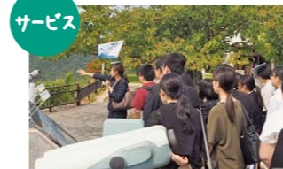
サービス ツアーコンダクターを体験