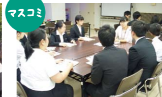
マスコミ 新聞づくりで地域を知る

現役の新聞記者と面談。毎日の取材や記事を書くことの大変さ、面白さが実感できます。新聞製作の現場を見る機会も。