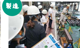
製造 ものづくりの現場を体感

現役の新聞記者と面談。毎日の取材や記事を書くことの大変さ、面白さが実感できます。新聞製作の現場を見る機会も。