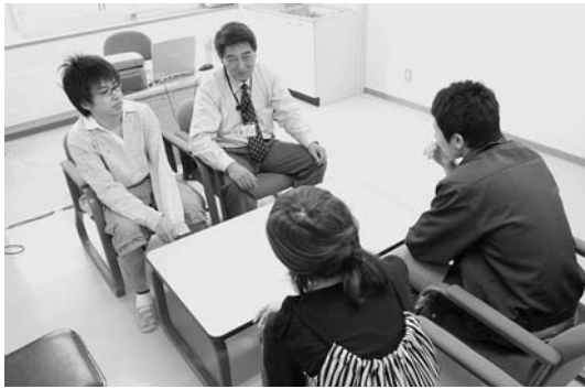
学生よろず相談室

そのためには、学生個々のニーズを正確に把握して、学生支援の過程が具体的に視覚化、体感でき、かつ支援を受けた学生がはっきりとした満足感や充実感あるいは達成感を持つことが重要であると考え、これを実現する一方策として、これまでの学年担任制に加えて、教員一人が五人程度の学生を受け持つ個別担任制を取り入れ、個々の学生の修学状況を把握しながら、学生の修学・生活相談に責任を持って対応する体制を複数学科で確立さ