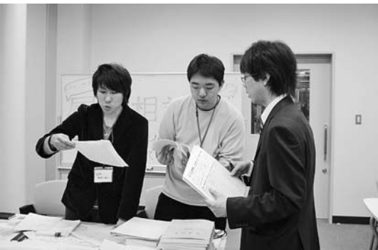
ピア・サポーターによる修学相談

せた。その結果、「学生の自己学習力が著しく向上した」、「異常行動(急に欠席が増えたなど)を素早く抽出でき、メンタルヘルスケアの重要な基礎データを提供できた」など、学生の修学指導やメンタルヘルスに成果を上げてきた。また、本学では年四回程度父母懇談会を各地で開催し、父母との個別面談を通じて学生個々の修学状況・学業成績