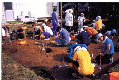
文化財学科発掘調査