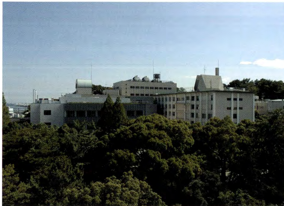
緑に囲まれたキャンパス

鶴見大学・鶴見大学短期大学部ホームページ http://www.tsurumi-u.ac.jp