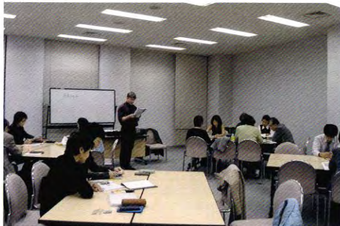
生涯学習セミナー

ガラスドーム状の屋根が特徴の鶴見大学会館は、JR鶴見駅より徒歩1分の好立地にあります。300人収容のメインホール、162人収容のサブホールをはじめ、各種会議に対応する会議室、授業でも使用可能なLL研修室・OA研修室などの研修室を有し、学生だけでなく、一般市民を対象とした公開講座「生涯学習セミナー」を開催しています。その他にも、地域に開かれた大学をめざし、講演・展示会等、地域住民にも広く開放されています。