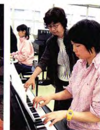
保育科ピアノ練習室