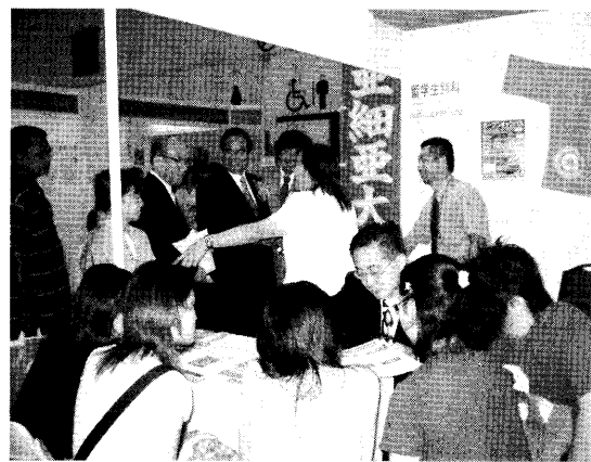
マレーシア会場大学ブース

マレーシアにおける日本留学フェアは、今回で一四回目の開催となった。ジョホールバルでは、日本の大学等の参加によるフェアとしては初めての開催となった。