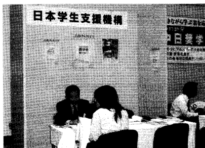
2006中部の私立大学展