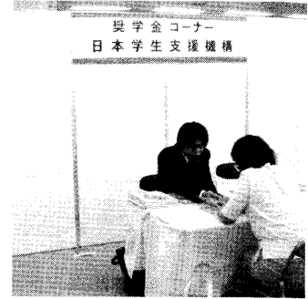
東京12大学進学フェア

また、予備校職員の方から、最近、奨学金に関する予備校生の問合せが多くなってきたので、奨学金制度全般について教えてほしいとの相談もありました。