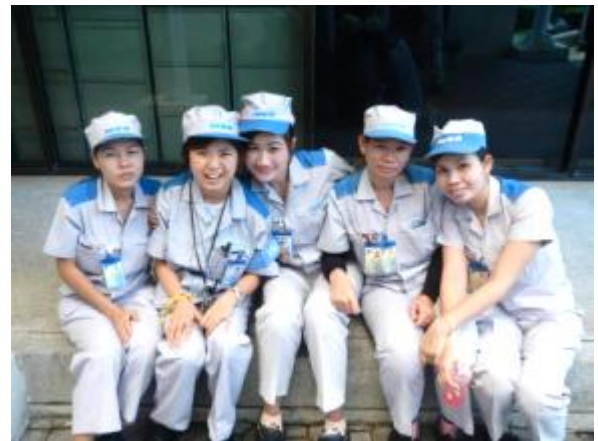
タイ人と一緒に働いた経験は一生もの