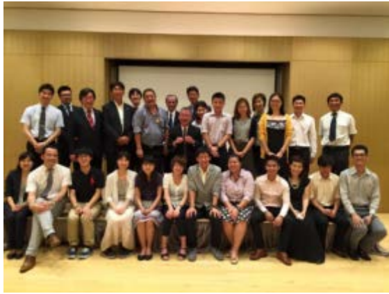
在タイ日本国大使館にて