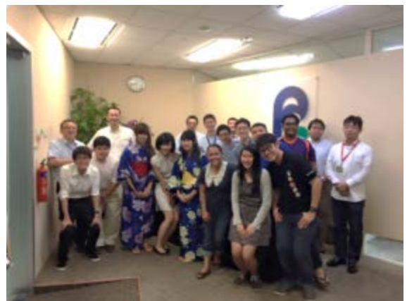
理化学研究所シンガポール事務所にて