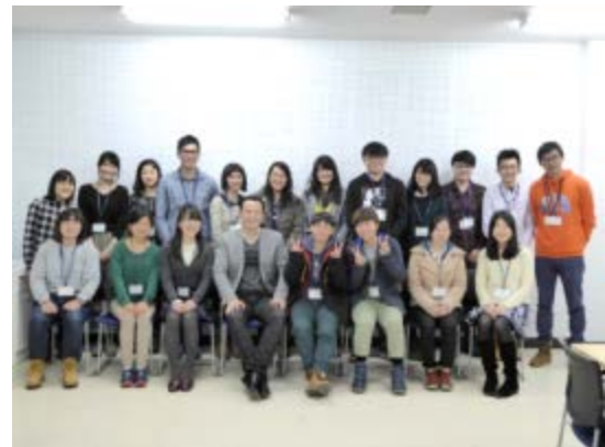
外務省 JENESYS プログラムで来日した台湾の大学生と交流