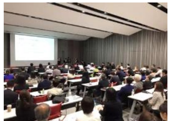
学会で学生発表を披露

海外探検隊プログラムは、2015年7月までに3度、グローバル人材育成教育学会で学生発表の場を得ている。海外派遣プログラムに参加して学生が何を学んだか、学生はどのようなプログラムを望んでいるか、グローバル教育の研究者に対し、リアルな情報提供をしてきた。また、帰国後の海外探検隊のOB/OGは、グローバル教育の実践