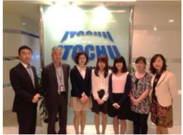
副社長も報告会に出席

また、伊藤忠商事シンガポールの事例では、同社がシンガポール人学生の新卒採用を始めることを検討していたため、シンガポール人学生の就職意識調査を行うことを提案し、それが了承された。学生達は、ここでもシンガポールのトップ校であるシンガポール国立大学と南洋工科大学に訪問し、シンガポール人学生へのアンケートを実施した。学内で開催されているキャリアフェアにも参加して、グローバル企業の新卒採用の手法を調査した。その結果をもとに新卒採用に関する学生視点からの提言を伊藤忠商事シンガポールに対して行ったのである。その報告会には、同社の副社長の参加もあったほど、学生達の一連の活動は業務に対する貢献度が大きいとして注目して頂いた。