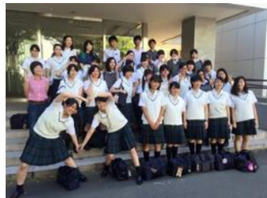
SGHアソシエイト校が来学

グローバル教育は、高大連携も実現するという例を紹介したい。文部科学省のスーパーグローバルハイスクール（SGH）構想を受けて、高校の現場にもグローバル教育の導入が進んでいる。ユニークな海外派遣プログラムを実施する本学に注目した全国の高校からの視察が増えているが、その中にはSGHやSGHアソシエイト指定を受けた高校が目立つようになってきた。海外探検隊のOB/OGは、大学のグローバル化をアピールすることに大変重要な役割を果たしている。