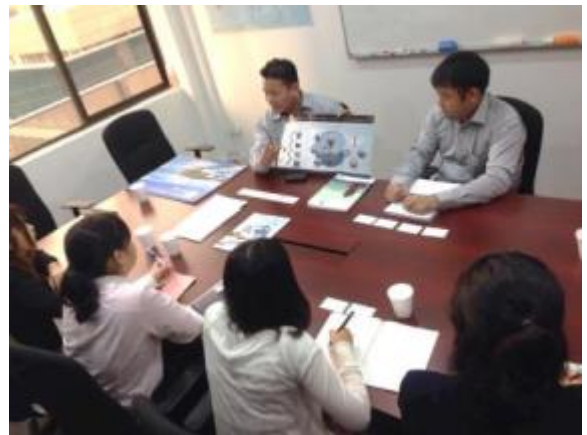
海図の読み方をプロから指南