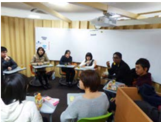
シンガポール国立大学の研究員が来日