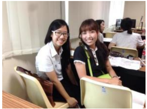
タイ人パートナーと

シラチャでの工場実習を終えた学生達はバンコクに戻り、残りの約2週間でチュラロンコン大学食品科学学科で過ごす。ここでは様々な実習に参加する。滞在中はチュラロンコン大学学生寮に滞在し、キャンパスライフを満喫し、さらにタイ人学生とのネットワークを広げることができる。