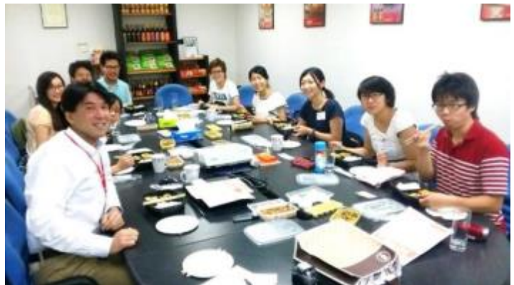
香港味の素グループにて