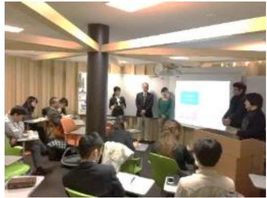
社会人と一緒に討論

海外探検隊のOB/OGにとって、プログラムに参加して一番刺激になったのは、現地で豊富に経験した社会人交流だったという学生が多い。この部分を日本に帰った後に学生だけで継続するのは難易度が高いため、担当教員がグローバルキャリア研究会（通称、グロケン）を主宰し、社会人と学生が交流する状況を継続して提供している。