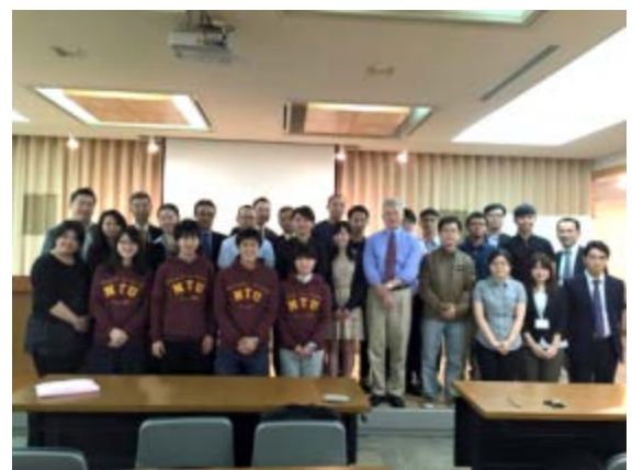
交流協会台北事務所にて