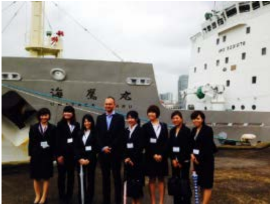
ノルウェー水産省副大臣に同行

大学には、定期的に海外から来客がある。海外大学の提携校やこれから交流が期待できる大学の学長や教授たち、そして各国の政府関係者や大使館からVIPが来学することも少なくない。そうした機会に海外探検隊の学生はたびたび動員され、学生代表として本学に来学した方をもてなす役割を担う。言わば、海外探検隊のOB/OGは、学生大使であり、学内の国際業務の学生請負集団である。これは教育的観点からも学生たちの自主性を育てる効果があり、学生も母校に貢献できることを誇りに感じている。また、こうした一連の行動は、学内のほかの学生にもポジティブな影響をもたらしている。