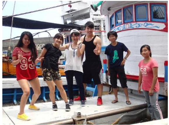
台湾大学海洋研究所にて

現地に到着した後、4名の学生たちは一人ずつ、自分が所属する研究室に配属されて1週間、研究生活をする。本学では4割の学生が大学院に進学するため、研究志向の強い学生が多く、ここで体験するリサーチインターンシップは、来るべき研究活動の先取り教育となり、学生たちからは大変好評である。では次に、いかに学生達を海外で安全に過ごさせるか、いわゆる海外派遣プログラムの安全対策について紹介したい。