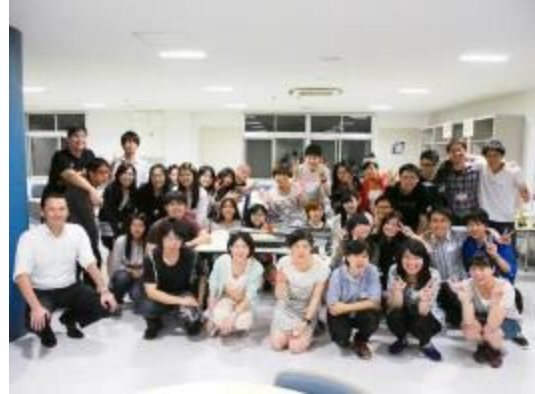
南洋工科大学日本愛好会の学生が来日