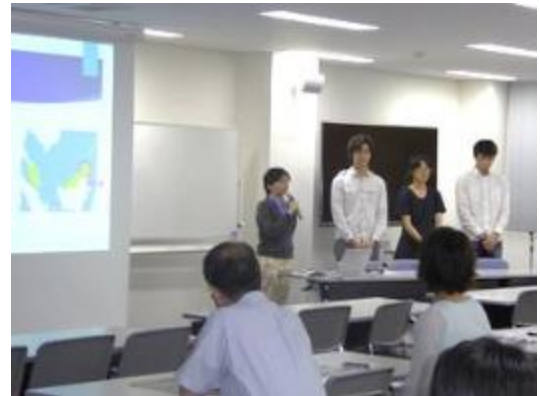
1カ月のプログラムを終えて

一方、帰国して通常の生活に戻った学生たちの中には、充実した海外生活から平凡な日本の生活に戻り、一種の喪失感を感じているものもいるが、この活動報告会は、今後、学生たちが自主的に学びの機会を増やすことによって、日本での生活をさらに充実させるための決起集会のような意味合いも持たせている。自分が知らない国に行って、同年代の仲間たちが頑張った様子を見ることができた学生たちは、活動報告会を終えた後は再度奮起して、新しい挑戦に一步を踏み出していく。