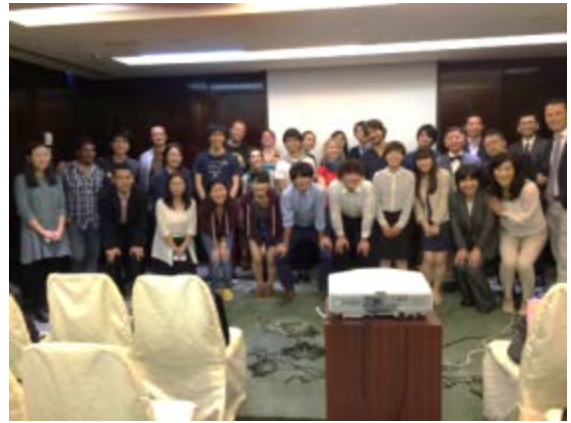
香港日本人倶楽部にて