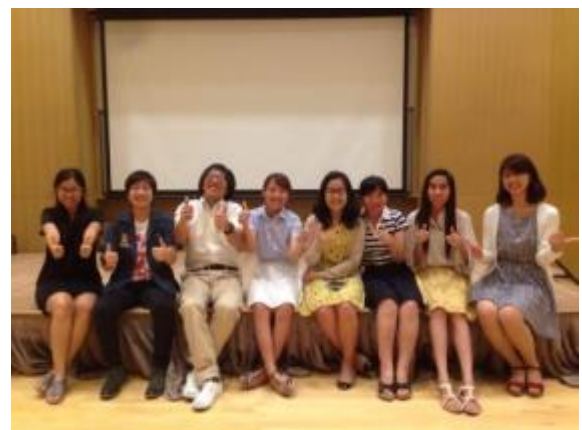
タイ人パートナーと成果報告会を実施