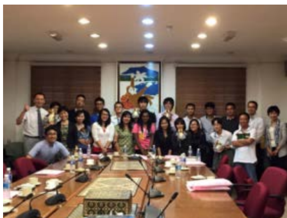
サバ州政府観光局にて