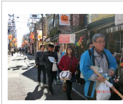
11月秋商店街ツアー