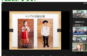
小学生とロシアのサポーターのオンライン国際理解教育の授業