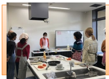
国際料理教室の様子