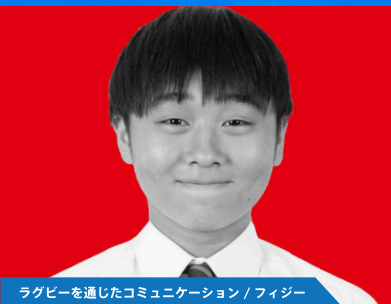
ラグビーを通じたコミュニケーション / フィジー