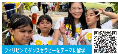
フィリピンでダンスセラピーをテーマに留学

ボストン大学サマープログラムでは、様々な医療体験、例えば人の皮膚に見立てたオレンジを縫う練習など実践的な学びがありました。寮生活も体験でき、世界中から選抜された同世代から刺激を受けました。