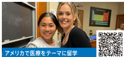
アメリカで医療をテーマに留学