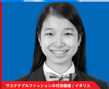
サステナブルファッションの付加価値 / イギリス