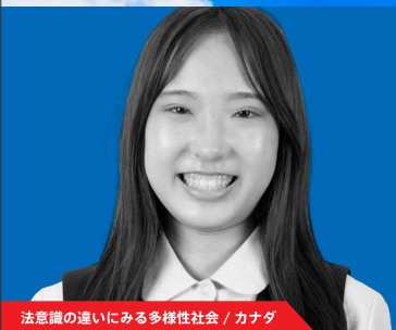
法意識の違いにみる多様性社会 / カナダ