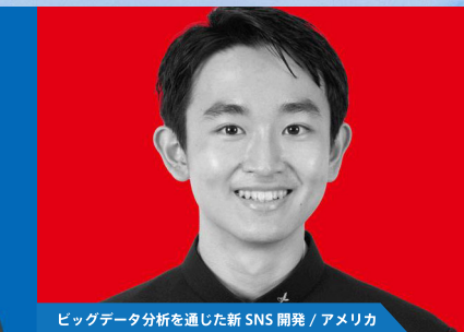
ビッグデータ分析を通じた新 SNS 開発 / アメリカ