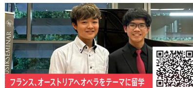
フランス、オーストリアへオペラをテーマに留学

高校で学んだ看護の力と、14年間のダンス経験と、高2から始めたダンスインストラクターの指導を活かして、スラム地区に住むストリートチルドレンに、ダンスセラピーを提供しました。