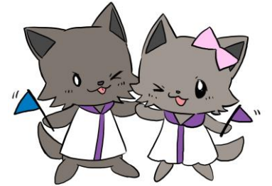
山梨大学 キャリアセンター