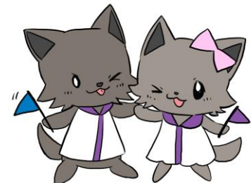
山梨大学 キャリアセンター

山梨大学は、 「地域の中核、世界の人材」 をスローガンに、「人」を生 かす大学運営を基本とし、 独創的な研究と学際的な教 育を推進しながら、真に地 域の活性化を担い世界で活 躍できる大学人を育成して います。