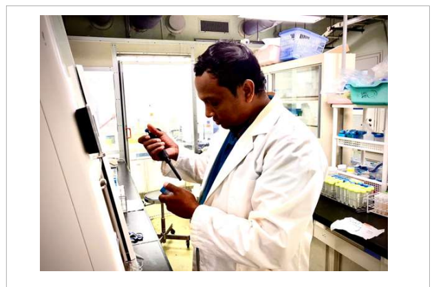
研究室における実験活動/ Working in Laboratory