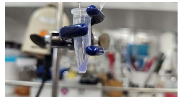
小スケールでの反応生成物の採取 / Collection of reaction products on a small scale