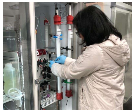
Operating Fast Protein Liquid Chromatography for Separation of Peptides