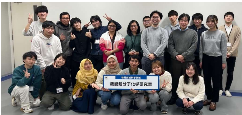
Gathering with Members of Functional Supramolecular Chemistry Laboratory

ペプチドのアミノ酸組成をNAISTで行った後、LC-高分解能質量分析計により全ての画分のペプチド組成とサイズを分析する。全てのデータをまとめて論文を執筆する予定である。次のステップとして、老化した線維芽細胞の再活性化におけるコラーゲンペプチドの活性を調査する予定である。BSFL画分については、in vitroでの創傷治癒活性の調査をインドネシアで実施する。今後もNAISTの物質科学領域およびバイオサイエンス領域と連携して、計画したこれらの研究を実施していく予定である。