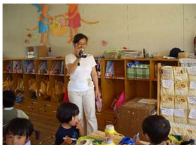
訪問先幼稚園での園児の昼食風景 Shooting kindergartners eating lunch at visiting preschool on her video