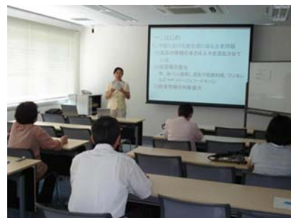
研究成果報告会 Presentation of the results of her research