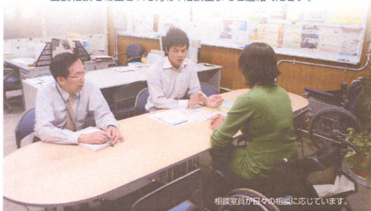
相談室員が日々の相談に応じています。