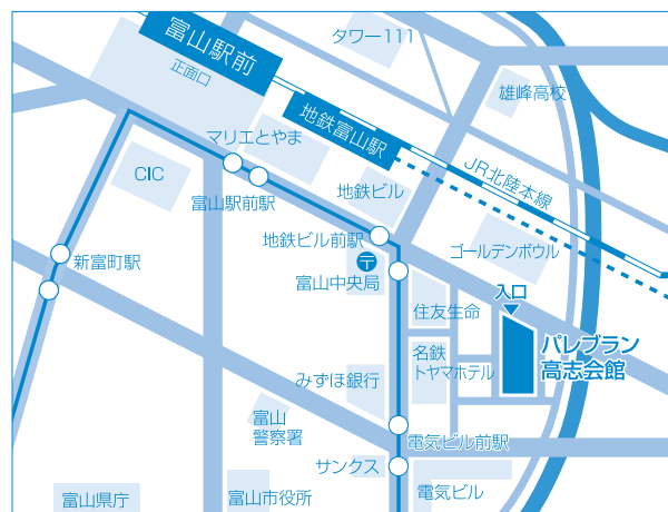
○JR富山駅正面(南)口より・徒歩7分 ○市内電車・地鉄ビル前駅/電気ビル前駅より徒歩4分 ※駐車場には限りがありますので、なるべく公共機関でおこください。

本学では、本事業の取組みを紹介するために、「トータル・コミュニケーション・サポート・フォーラム2008」を開催いたします。第一部では、学生支援の「場」をどのようにマネジメントするかに焦点を当て、SNS(ソーシャル・ネットワーキング・サービス)機能活用の可能性も踏まえながら、本学も含めた各大学や企業からの話題提供を行います。第二部では、本事業の推進組織であるトータルコミュニケーション支援室の活動報告を行うとともに、発達障害学生支援の国内外の動向、当事者からの視点による発達障害学生支援の在り方について話題提供を行います。多くの皆さまのご参加をお願いいたします。